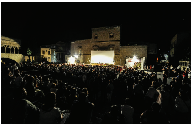
PIAZZA SAN LORENZO, LOCATION STORICA DI NUMEROSI FILM

Dentro e fuori le mura cittadine sono state girate pellicole apogetiche del primo fascismo ( Vecchia guardia , 1935, di Alessandro Blasetti), belliche ( Un pilota ritorna , 1942, di Roberto Rossellini) e ispirate a figure storiche (Michelangelo Buonarroti, Il tormento e l'estasi , 1965, di Carol Reed; Martin Lutero, Luther , 2003, di Eric Till). Vie e piazze viterbesi hanno altresì ospitato trasposizioni cinematografiche di opere teatrali di Shakespeare ( Otello , 1951, diretto e interpretato da Orson Welles) e Machiavelli ( La mandragola , 1965, di Alberto Lattuada), la commedia Troppa grazia (2018) di Gianni Zanasi, La sindrome di Stendhal (1995) di Dario Argento e molti altri ancora. Tanti anche i film ambientati nelle frazioni della città come, ad esempio, Il medico e lo stregone (1957) di Mario Monicelli a San Martino al Cimino e Habemus Papam (2011) di Nanni Moretti, girato nei giardini di Villa Lante a Bagnaia. Tra la fine del '900 e gli albo-